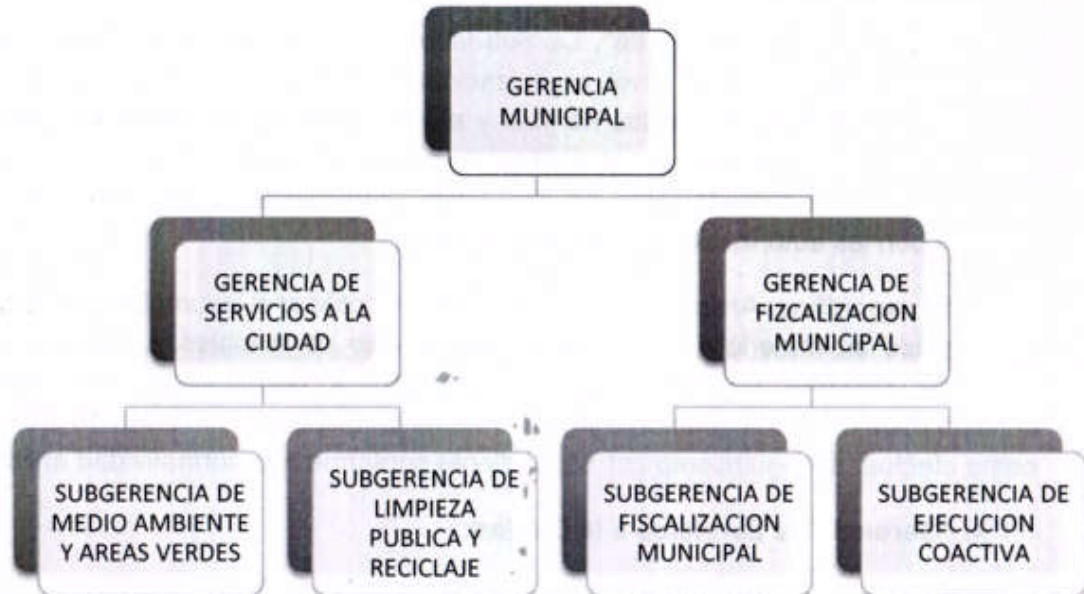
Figura N° 1.-Estructura Orgánica con competencias Ambientales